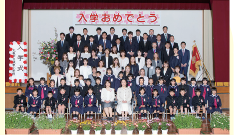
1 年 1 組

4 月 8 日 (金) 令和 4 年度の入園式を行いました。3 歳児 11 名、4 歳児 1 名の新入園児を迎え、総勢 45 名になりました。どきどき、わくわく心動かされる体験を重ねる中で、たくましく、しなやかな心と体をもった子どもたちを育てていきたいと思ひます!