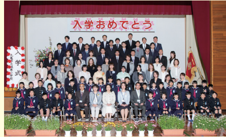
1 年 2 組