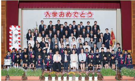
1 年 3 組