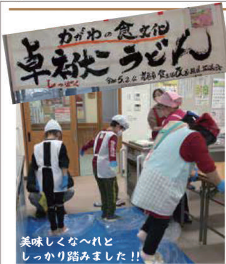
美味しくな〜れど しっかり踏みました!!