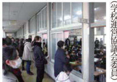
(学校運営協議会委員)

もうすぐ2年生になる1年生は、はきはきと自分たちの成長ぶりをしっかり発表しました。また、もうすぐ卒業の6年生はそれぞれの発表と同時に父兄への6年間の感謝と、新中学生へ旅立ちの意欲を強調しました。私が目当ての教室を配置図で探していたとき、「何かお困りですか？」と一人の男子児童に声をかけられました。この日一番記憶に残ったうれしい出来事でした。