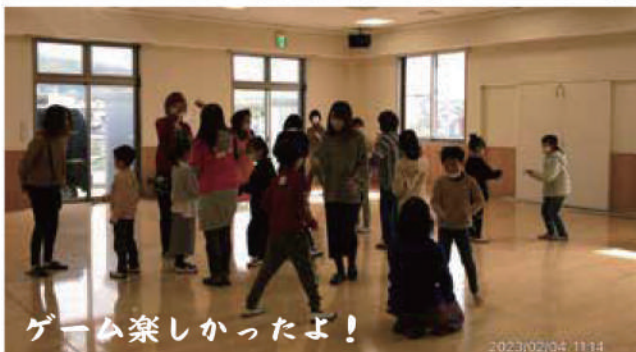
ゲーム楽しかったよ!